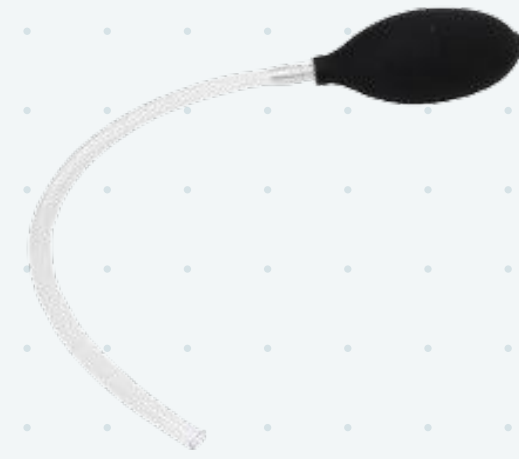
Механическая груша с трубкой