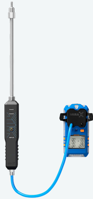
Моторизированный насос для отбора проб